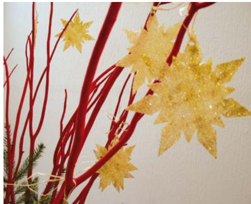
Glitzernde Dekosterne aus ASLAN Doppelklebefolie, beidseitig mit Goldglitter bestreut