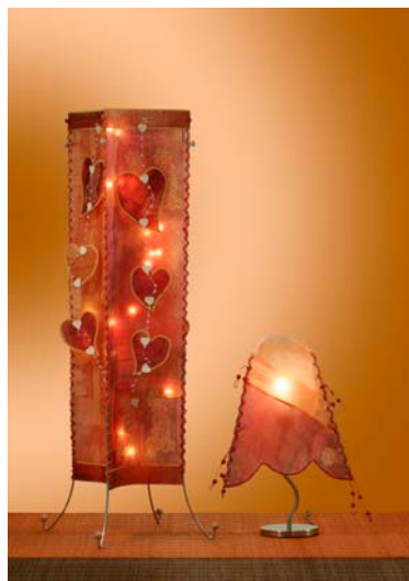
Individuelle Lampenschirme aus ASLAN Hart-PVC-Folien